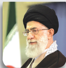
مقام معظم رهبری، مشهد مقدس، اول فروردین ۱۳۹۱

ملت آماده، عازم و بانشاط ایران، در فکر تهاجم و تجاوز نیست اما به هستی، ثروت، هویت، اسلام و جمهوری اسلامی خود با تمام وجود دلبسته است و از آنها دفاع خواهد کرد.